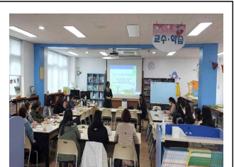
도서관 자원봉사의 꽃 명예사서회 총회 및 연수