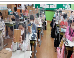
다함께 하는 칼림바 연주