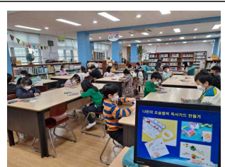
두근두근 처음 도서관 신입생 도서관 교육