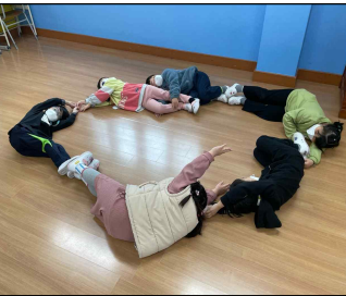
몸으로 자음, 모음자 만들기