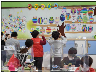
우리들 숨씨 최고