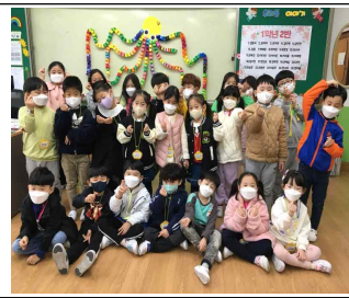
협동 문어 만들기