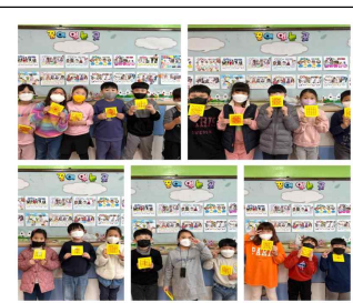
고무줄로 모양 만들기