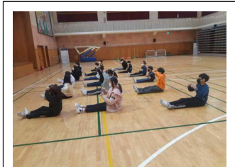
오학년 즐거운 무용 수업