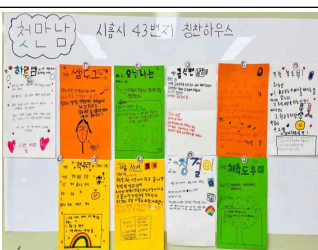
첫만남 프로젝트:의미있는 역할