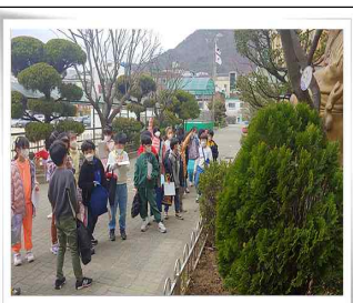
봄맞이 식물 관찰하기