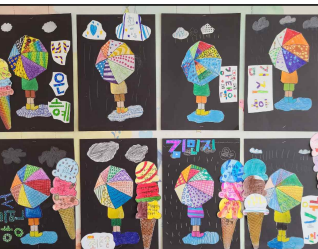
비 오는 날 아이스크림