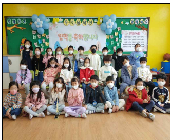
함께하는 추억여행의 시작 !