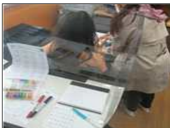
우리반 한 해 기록하기